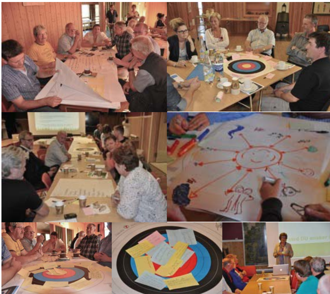
Under grendemøtene ble det flittig jobbet med å finne unikheten til Landsbyen Flisa.

Det kom mange kreative innspill på hvordan Landsbyen Flisa bør profileres, alt i fra flotte tegninger til stikkord. Det som gikk igjen var det flotte landskapet, menneskene og Kaffegata omkranset av grendene. Det ble også stilt spørsmål om det er nødvendig med en egen logo for Landsbyen Flisa, og om landsbyen kan profileres ved å vise stolte og fornøyde innbyggere i ulike situasjoner.