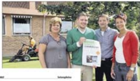
Olav Thon og Prinsesse Märtha

Forprosjektet mot landsbystatus i Åsnes kommune vil ikke overse ungdommen og inviterer dem derfor til landsbystatusmøte på Flisa ungdomshus barn og unges kulturcenter - F.U.K torsdag for det aller første Landsbyrådet. - Det er viktig at dem får komme med sine tanker og ideer også.