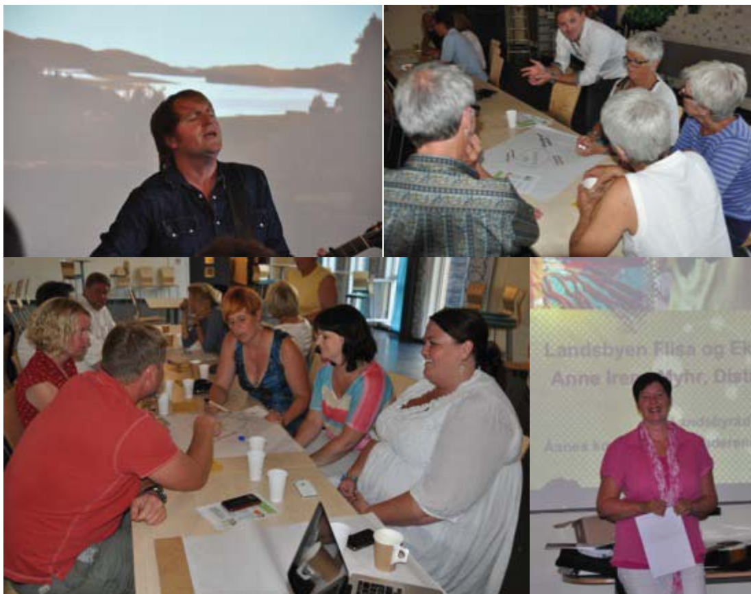
Under Landsbyrådet ble det vist stort engasjement for Landsbyen Flisa.

Landsbyrådet sikrer bred forankring og deltakelse. Alle innbyggere, ansatte i Åsnes kommune og næringsdrivende som har interesse for landsbyutvikling inviteres til å delta i rådet. Dette blir en viktig møteplass som skal bidra til å utvikle nye tanker og tiltak som bringer oss nærmere visjonen. Formelt sett har Landsbyrådet rollen som hørings- og innspillsarena.