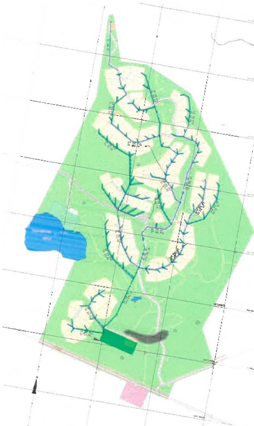
Oversiktsplan vann- og avløp