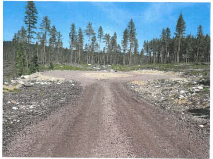
Gode rundkjøringer er viktig på våre veger. Her fra endesnuplass på ny veg i Haukåsen

gnettet og gjort noe opprusting på mindre vegstrekninger.