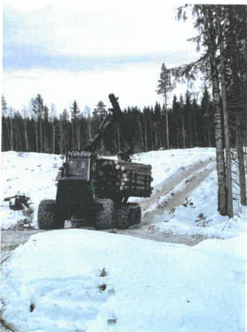
Lassbærer fra Solør Videregående skole Sønsterud var med på drift i Sjølisætra

Skogbruksplanen ble gjennomgått på nytt i 2019 med henblikk på at vi skulle lage en ny langtidsplan. Denne viser at vi har en stabil tilvekst og god balanse i skogen. Vi har nå kommet mer ajour med uttak av gammel granskog.